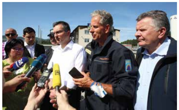
Predsednik vlade Marjan Šarec je pohvalil delo gasilcev in pristojnih služb.