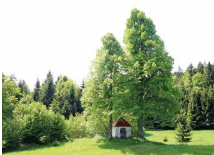
Zibovniška kapelica v prijetni senci dveh lip