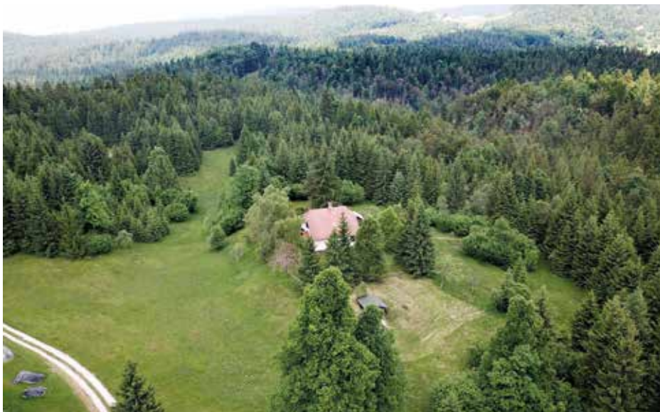
Sredi jase hišica, v grabnu žubori Otavščica.