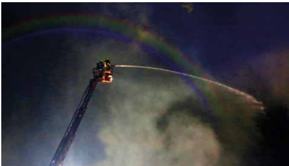
Požar je bil lokaliziran med deseto zvečer in polnočjo.

voda zaradi kraškega terena lahko doseгла področje vrtnine. Centru za šolske in obšolske dejavnosti Rakov Škocjan, Hotelu Rakov Škocjan ter uporabnikom, ki imajo na tem območju lastno oskrbo z vodo, so tako priporočili, naj vode do preklica preventivnih ukrepov ne pijejo in ne uporabljajo za pripravo hrane. Se je pa pokazalo, da pitna voda tudi na omenjenih zajetjih ni ogrožena. Vsi rezultati meritev, ki jih ARSO dnevno izvaja na več merilnih mestih, niso pokazali prisotnosti onesnaževal. Kljub temu ARSO z monitoringom še nadaljuje. Rezultati analiz mivke, odvzete v Vrtcu Martin Krpan Cerknica, ter rezultati analiz vzorcev solat v Cerknici in Begunjah pri Cerknici so pokazali, da so mivka, vrtnine in sadje, ki niso vidno onesnaženi, varni za uporabo. Kot priporočajo pristojne službe, pa naj prebivalci pridelke, onesnažene s sajami, zavržejo.